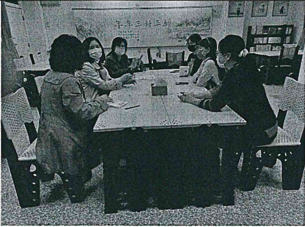
照片說明：閱讀課程教學成果分享