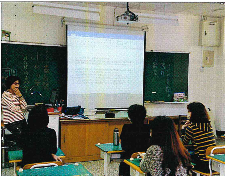
照片說明：討論會議議題—素養導向命題