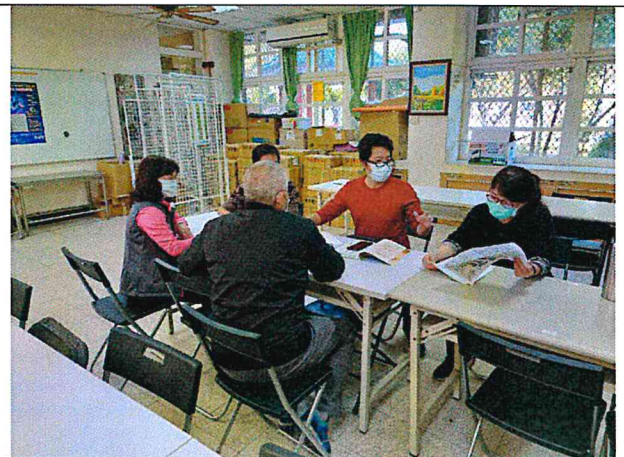
照片說明：素養導向評量議題討論