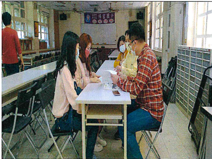
領域會議活動照片