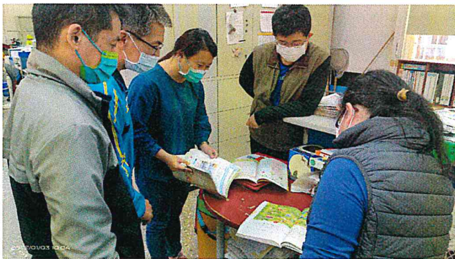
照片說明：心得分享