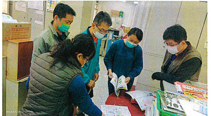
照片說明：素養題命題