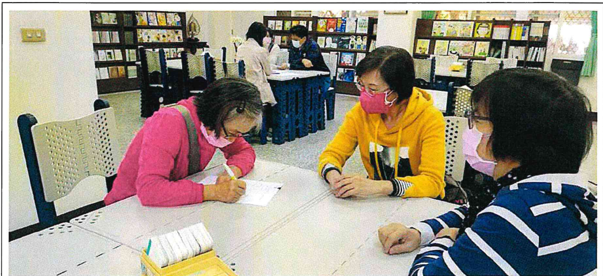
照片說明：生活領域會議主題討論照片二