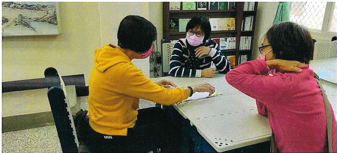
照片說明：生活領域會議主題討論照片三