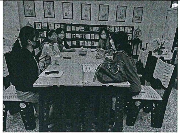
照片說明：閱讀課程實施之檢討與建議