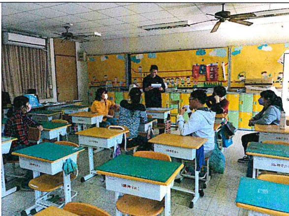
照片說明：討論領域議題