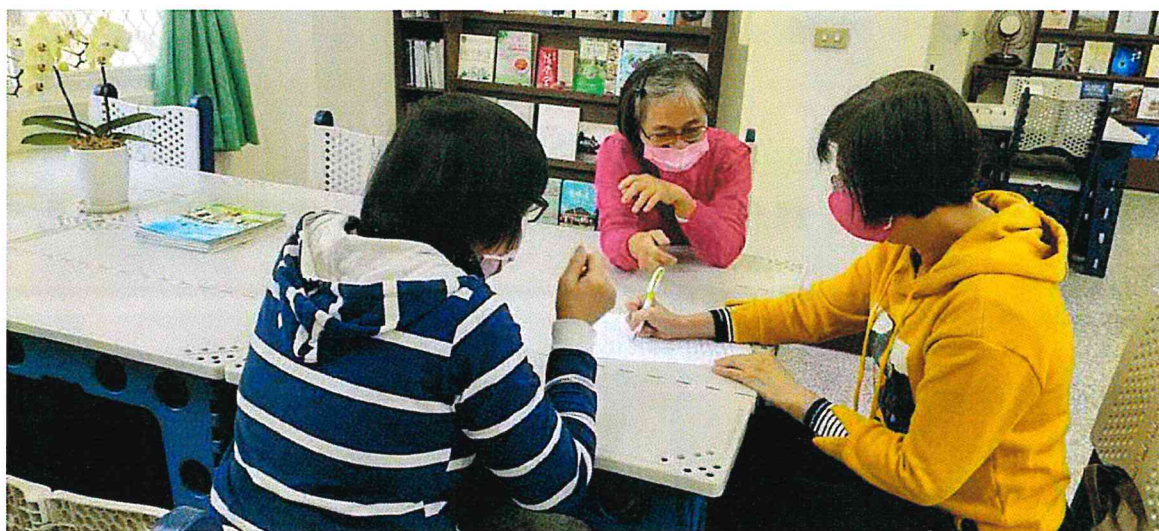
照片說明：生活領域會議主題討論照片一