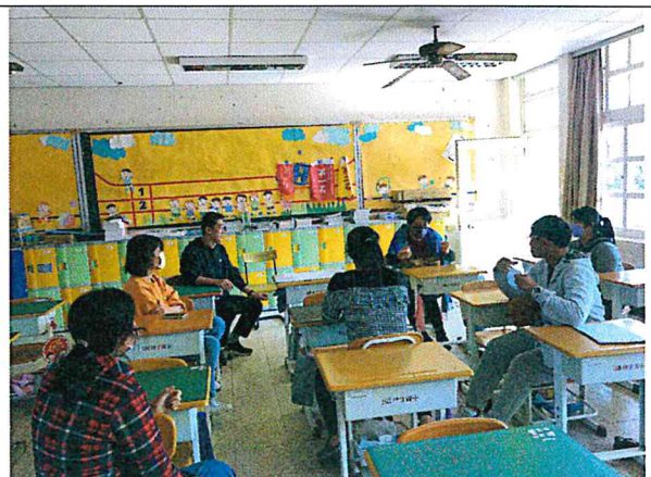
照片說明：老師們針對題討論