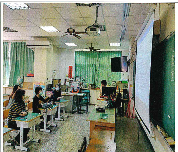
照片說明：教學成果分享與檢討