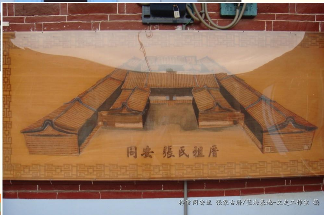
梓官同安里 張家古厝